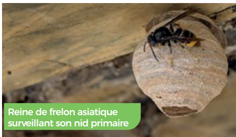
Reine de frelon asiatique surveillant son nid primaire

à une petite boule de papier mâché, d'abord de la taille d'une mandarine puis d'une orange puis d'un pamplemousse... Ces nids primaires peuvent se trouver sous une corniche, un carport, dans un abri de jardin, une cabane d'enfants, un meuble de jardin, un nichoir, une boîte aux lettres ou dans une haie. Inspectez donc attentivement tous les recoins de votre jardin une fois par semaine.